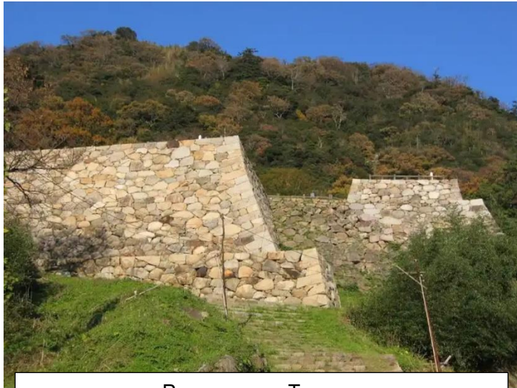
Руины замка Тоттори