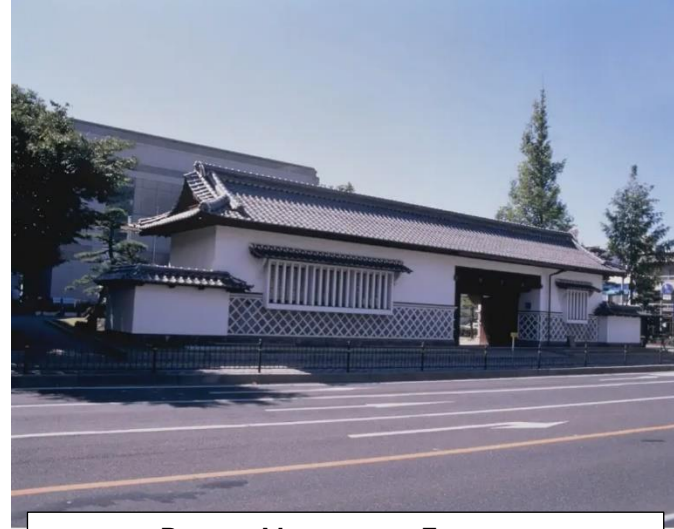
Ворота Миноура-ке Букемон